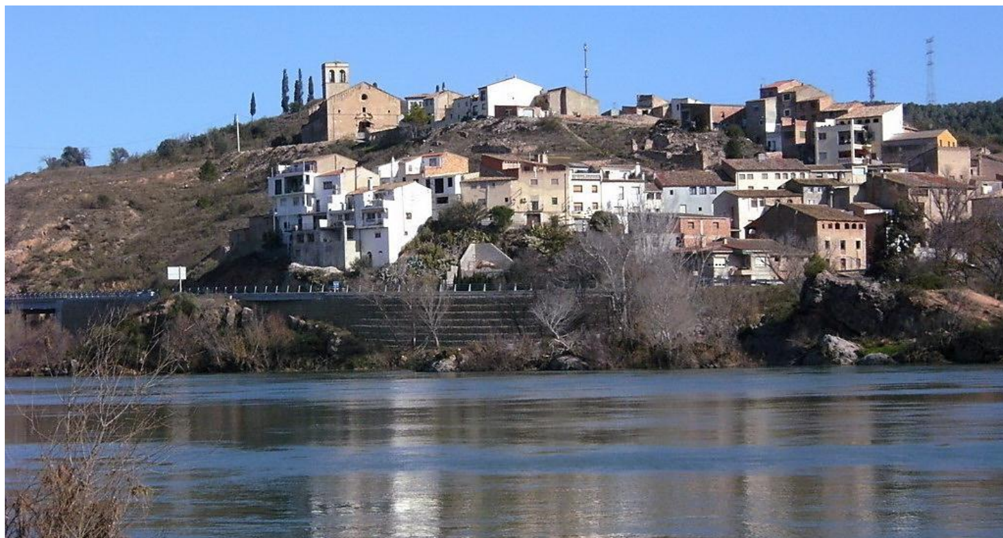
L'Ebre, al seu pas per García