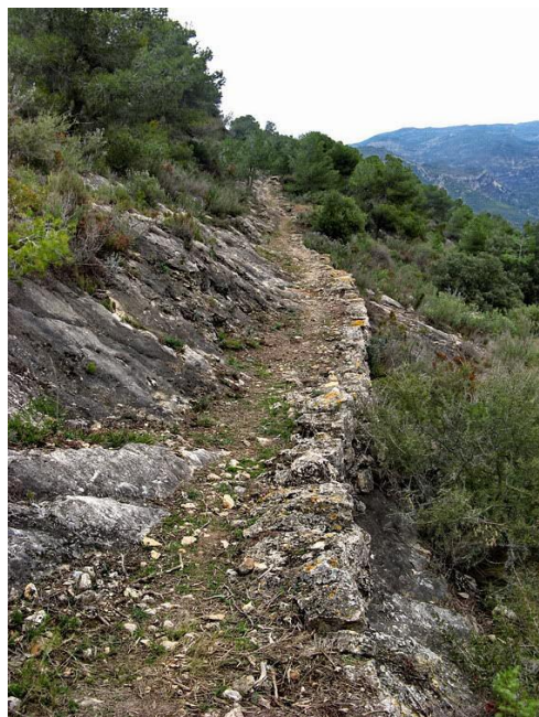
GR 171 prop de La Figuera

Troben diverses bifurcacions del camí, portant sempre direcció nord-est, fins arribar al llit del barranc, que travessem en uns 250 metres. Sortim a la carretera de Garcia que ens portarà al poble d' El Molar . Deixem a l'esquerra del camí el mas de Pinyol i el mas del Severino i entrem a la població d' El Molar (250 m), situat a la vall del riu Siurana, comarca del Priorat. L'església parroquial, dedicada a Sant Roc, és d'estil neoclàssic. En el municipi es descobrí, l'any 1930, el primer jaciment hallstàtic de Catalunya amb el poblat i la necròpolis. Sortim d' El Molar per l'anomenat camí de les mines, on hi ha les instal·lacions d'unes mines abandonades. Travessem la carretera T-730 d' El Molar a El Lloar i passem a frec de les runes de l'antic mas Joaneta , a l'esquerra del barranc dels Tortells . Anem pujant pel camí, guanyant alçada progressivament; passem sota una línia d'alta tensió i deixem a l'esquerra