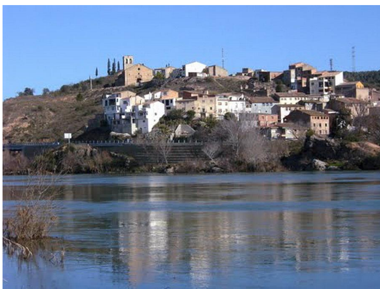
L'Ebre, al seu pas per Garcia

Ara, el GR baixa pel barranc de Roians i passa sota la via del tren. A l'esquerra, hi ha la derivació del pas de barca de Garcia. Arribem finalment al riu Ebre (70 m). Hi ha la possibilitat de travessar l'Ebre pel famós pas de barca, és una variant del GR 171. No obstant, les marques principals del GR travessen l'Ebre pel passadís per a vianants que hi ha al pont de la via del FFCC. Un cop