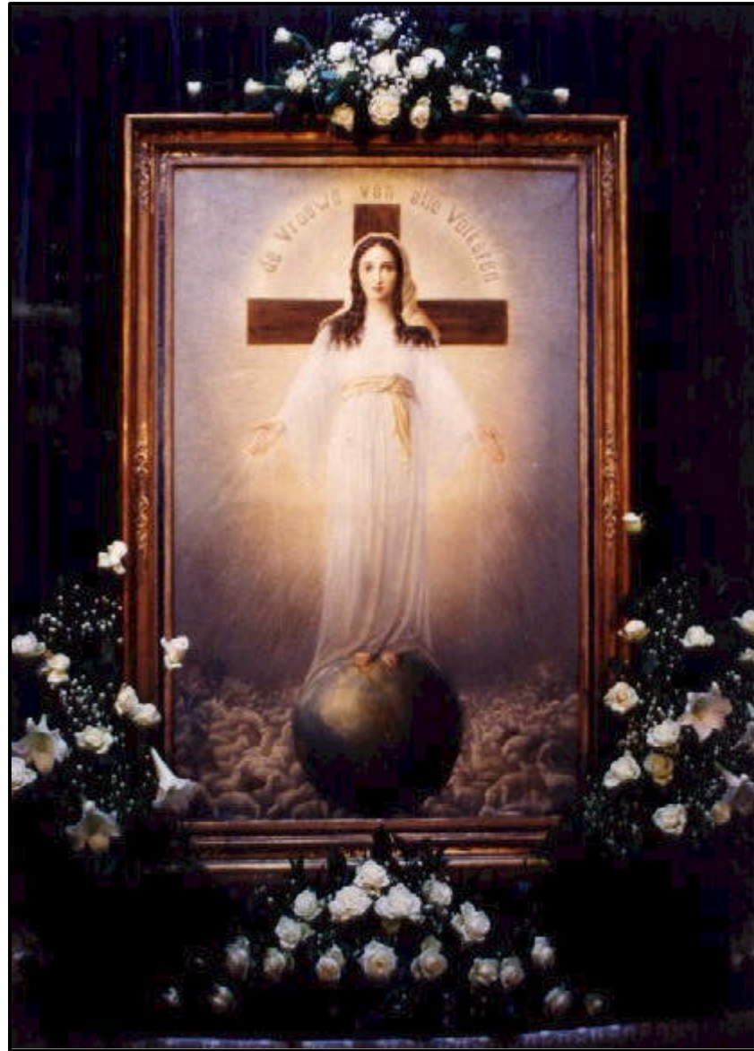
La Señora de Todos los Pueblos, óleo que reproduce su aparición, que se venera en la Capilla de Amsterdam, que preside las multitudinarias jornadas internacionales de oración.