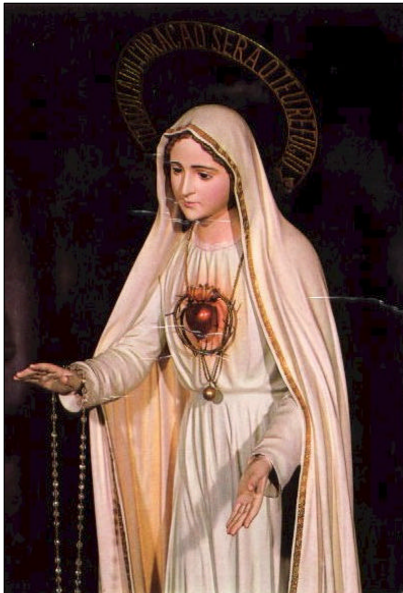
Imagen del Corazón Inmaculado de María, venerada en el Carmelo de Coimbra, donde se encuentra Sor Lucía.