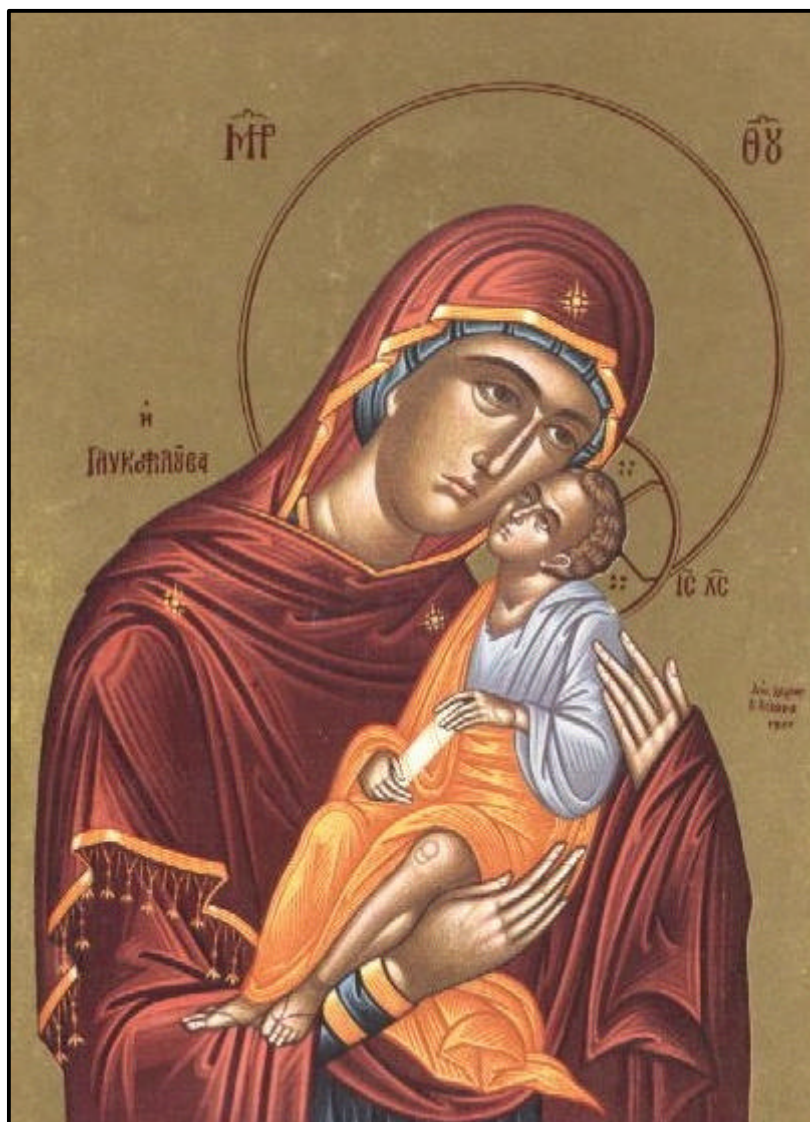
Icono griego de la Glicofilusa (la que lo besa dulcemente). Los íconos bizantinos de la Virgen Santísima llevan tradicionalmente tres estrellas en su manto: una sobre el hombro derecho, otra sobre la frente, y la tercera sobre el hombro izquierdo, simbolizando la virginidad perpetua de la Santísima Virgen: antes del parto, durante el parto y después del parto.