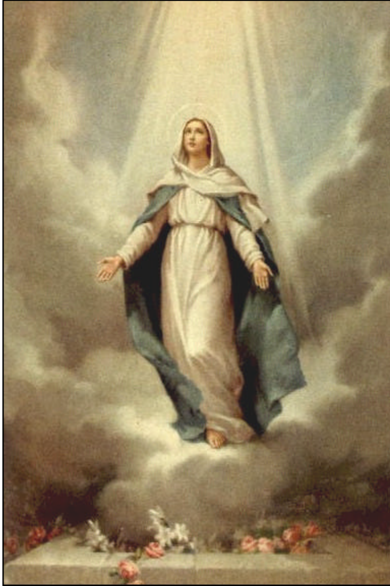
“4 to Misterio Glorioso. La Asunción de María en cuerpo y alma a los cielos”. De la serie de estampas populares que representan los 15 misterios del Santo Rosario.