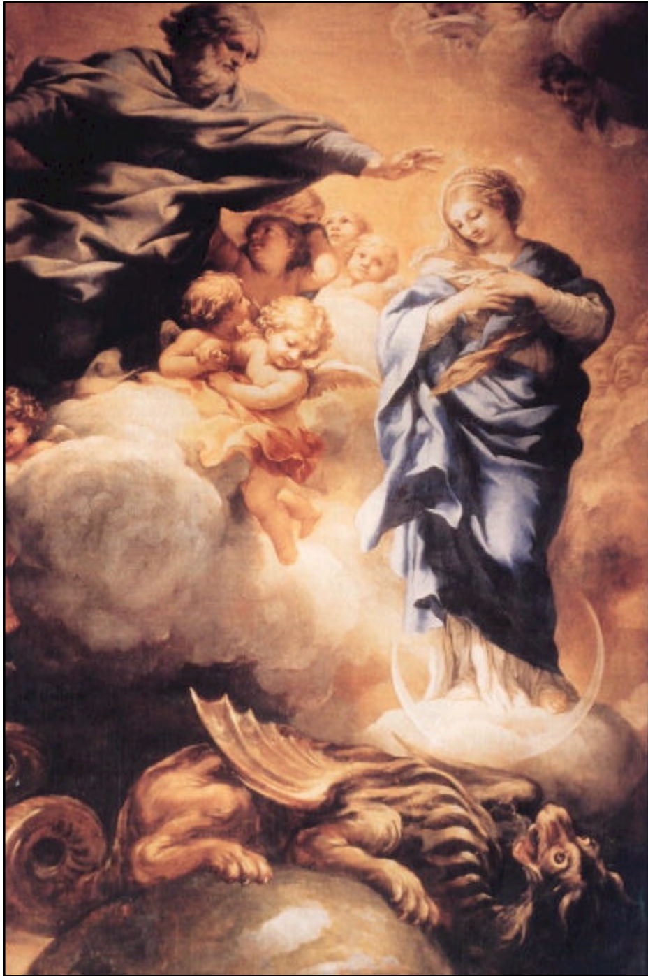
La Inmaculada de Guercino. En este sublime misterio la Santísima Virgen fue representada tradicionalmente con un manto azul, y con las notas al Apocalipsis: vestida de sol, la luna debajo de sus pies, y en su cabeza una corona de doce estrellas.