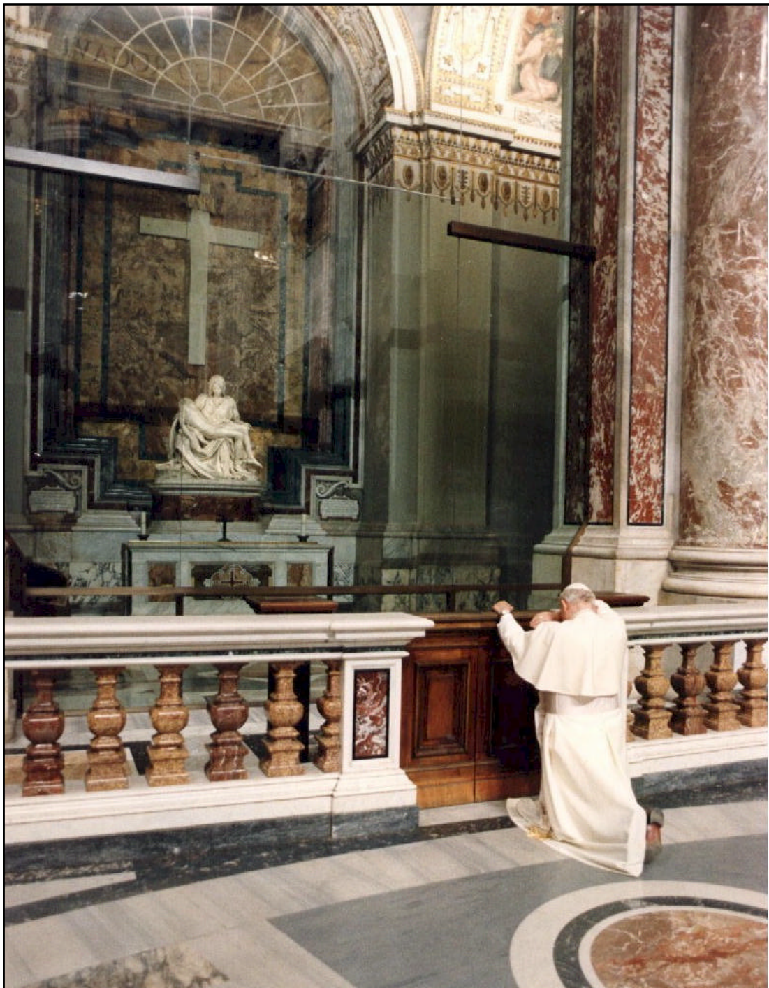
El Papa Juan Pablo II ora ante la Corredentora. La imagen de La Pietá de Miguel Angel es el emblema de Vox Populi Mariae Mediatrici.