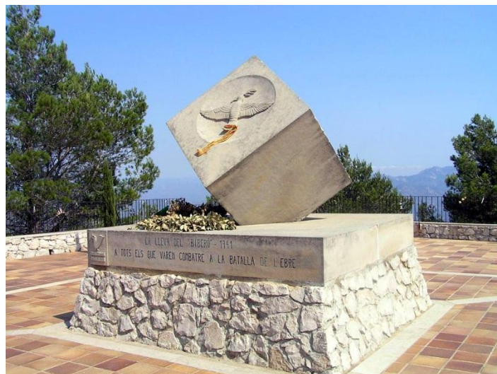
Monument a la Pau, serra de Pàndols

A partir d'aquí, el GR travessa per unes balconades