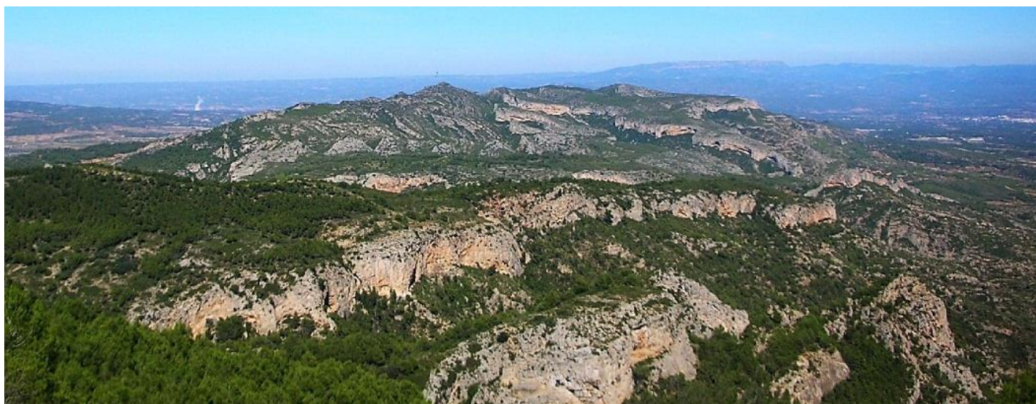
Serra de Pàndols