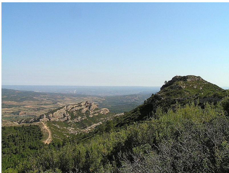
Punta Redona i Roca del Pebre

Iniciem aquesta tercera etapa a la localitat vitícola de Gandesa, capital de la Terra Alta, famosa pel seu Celler modernista. Trobem les marques de GR 171-3, variant del 171, prop de la carretera C-235, de Gandesa a Tortosa, les quals seguirem un tram del recorregut inicial fins trobar el GR 171 al barranc de la Fonteta. Arribem a la Fonteta, zona d'esbarjo al peu de la majestuosa serra de Pàndols, prop de la carretera C-235 de Gandesa a Tortosa. Seguim durant uns minuts la variant GR 171-3 en direcció sud-est fins a trobar el punt de confluència amb el GR 171, just on el vem dirar l'etapa anterior; el seguim en direcció nord cap a la serra de Cavalls . El GR puja per un camí perdedor, cal cercar els millors passos. A l'esquerra, trobem el camí a Sant Marc i la Mola d'Irto , a la dreta la serra de Cavalls . Es creua el tàlveg del fons de la vall per la vora d'unes vinyes i es remunta per l'altra vessant a buscar el punt més alt de la serra, la Punta Redona (659 m), vèrtex geodèsic. És el portell de la serra on