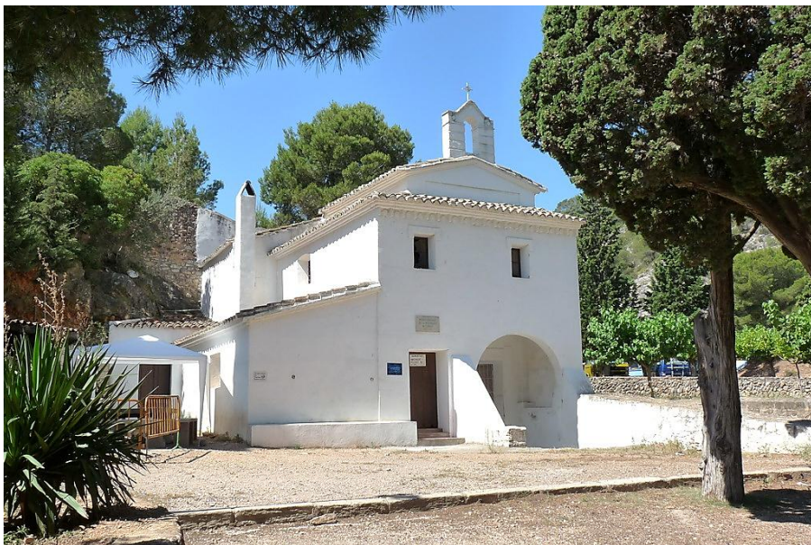
Ermita de Sant Jeroni

encara es poden veure refugis i trinxeres de la guerra del 36; la panoràmica des d'aquest punt sobre la comarca de la Terra Alta és extraordinària. La serra de Cavalls és la continuació nord-oriental de la serra de Pàndols, separa els termes del Pinell de Brai (Terra Alta) dels de Gandesa i Benissanet (Ribera d'Ebre) i va ésser escenari de violents combats durant l'ofensiva de l'Ebre de la guerra del 1936-39.