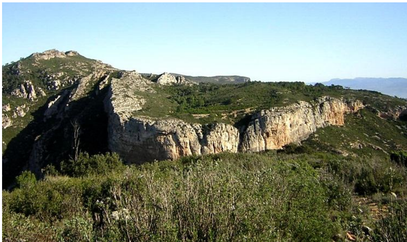
Serra de Cavalls