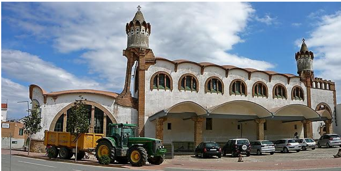
Celler de la Cooperativa Agrícola de Gandesa

Les vinyes, oliveres i fruiters envolten les llomes i ordenen la visió de les extenses planes de luví que es dibuixen en l'horitzó. Penyals, barrancs i abruptes serres se succeeixen a la comarca de la Terra Alta i els seus voltants. Som al sud de Tarragona, i l'Ebre, prop ja del final del seu recorregut, és el gran protagonista a tota la zona. Des de les altures de les serres de Pàndols i de Cavalls es dominen amplis panorames cap a l'est que fan possible seguir les últimes etapes del seu curs, els meandres que traça i les hortes que va deixant al seu pas.